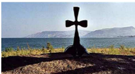
Pierre marcha sur les eaux pour aller vers Jésus Mt 14, 29